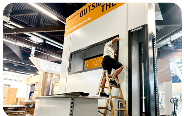
Flexibler Messestand von Wörnlein im Aufbau

auf Lösungen, die Menschen in den Mittelpunkt stellen und individuell einsetzbar sind.