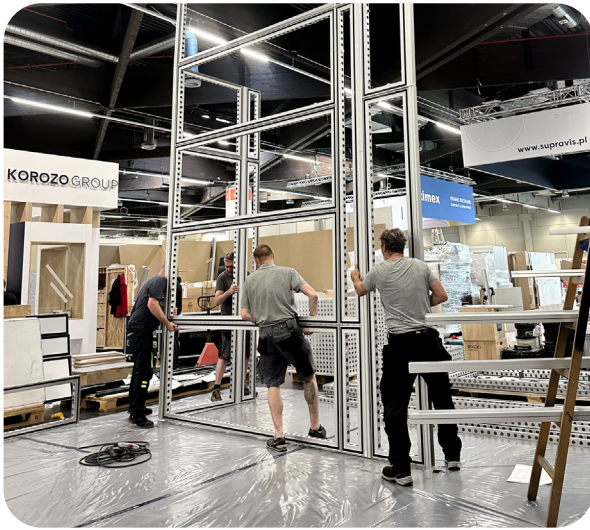
Das Montage-Team von Wörnlein ist rund um die Uhr im Einsatz